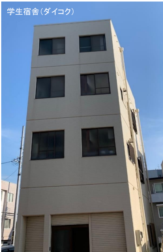
学生宿舎(ダイコク)