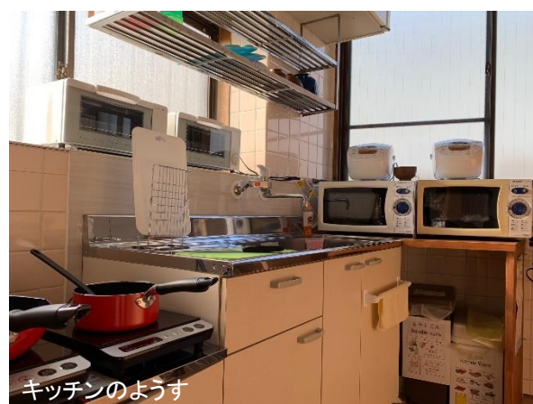
キッチンのようす

学校宿舎に関するご質問は、Eメール( info@toyohashi-japanese.com )にて受け付けております。