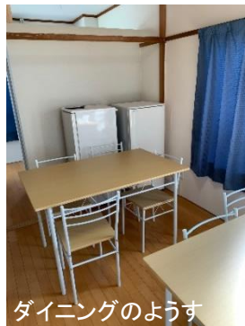
ダイニングのようす