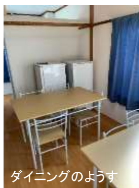
ダイニングのようす