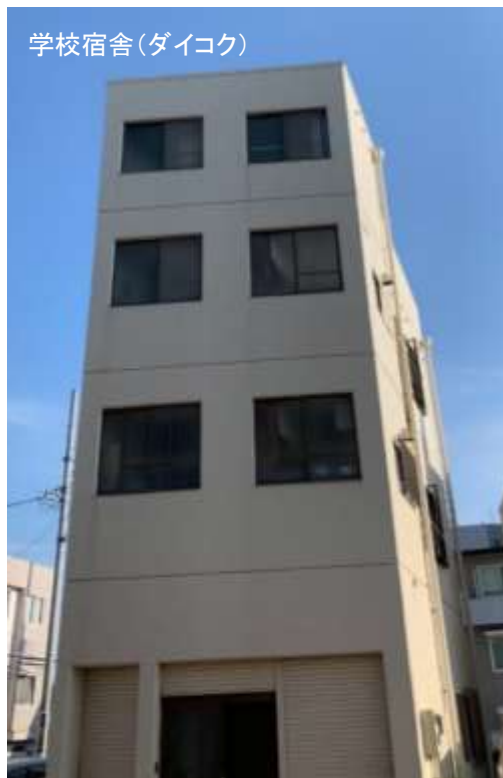
学校宿舎(ダイコク)