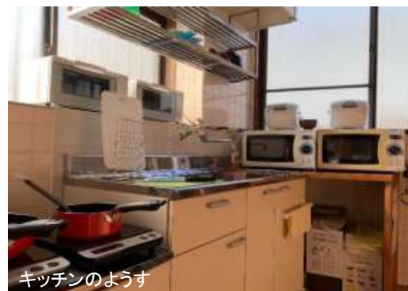
キッチンのようす

学校宿舎に関するご質問は、Eメール( info@toyohashi-japanese.com )にて受け付けております。