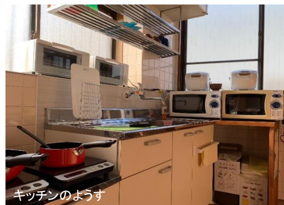
キッチンのようす

学校宿舎に関するご質問は、Eメール( info@toyohashi-japanese.com )にて受け付けております。